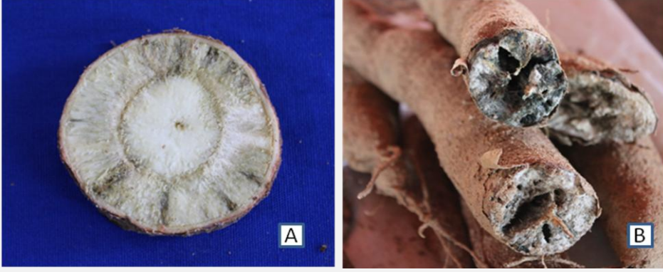
A) முதன்மை வாஸ்குலர் ஸ்ட்ரீக்கிங்/ சீரழிவு B) நுண்ணுயிர் சீரழிவு