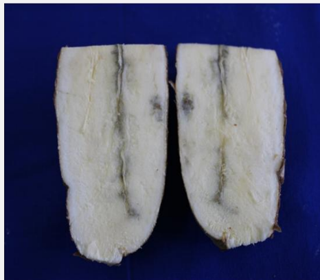
அறுவடை செய்த மரவள்ளிக்கிழங்கு வேர்களில் நீலம் கலந்த கருப்பு வாஸ்குலர் ஸ்ட்ரீக்கிங் போன்ற பிபிடி அறிகுறி